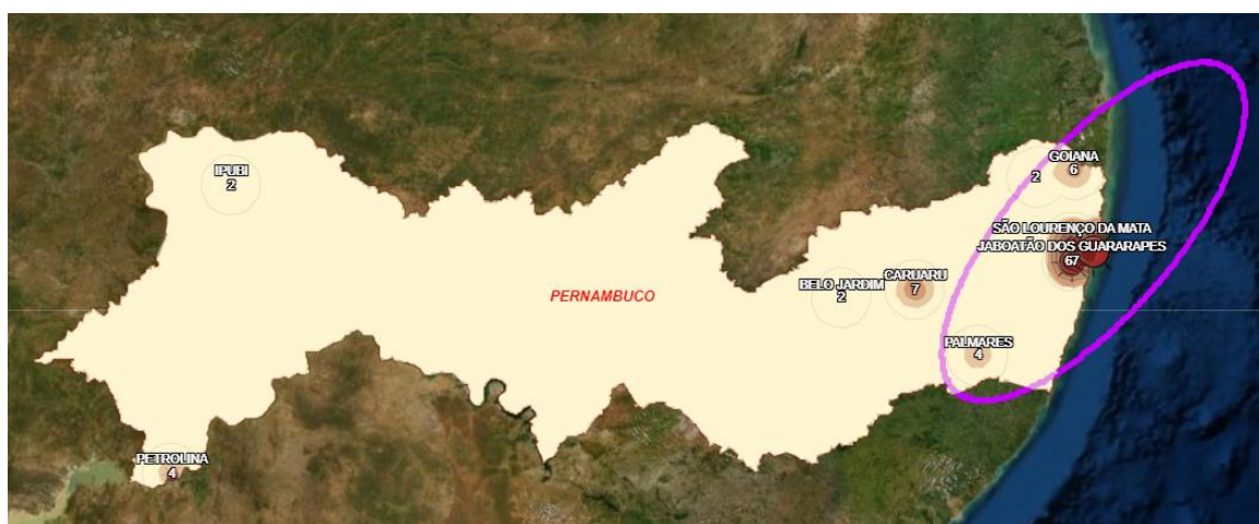
Figura 1: 01 de Abril - 90 casos residentes

Abril foi o mês da conquista do território pernambucano pela pandemia. Analisando os mapas e dados de abril do painel analítico disponibilizado pelos pesquisadores do Centro Integrado de Estudos Georreferenciados (CIEG) da Fundação Joaquim Nabuco (Fundaj) é possível verificar como ocorreu essa conquista, a evolução e a dinâmica espacial dos casos.